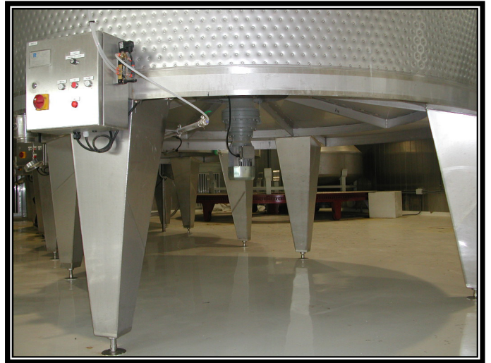
• DETALLE DEL FONDO DEL DEPOSITO