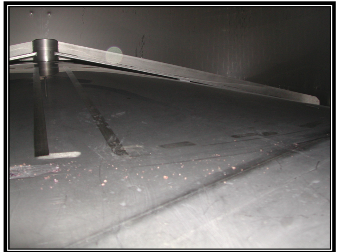
• DETALLE DE LAS ELICES