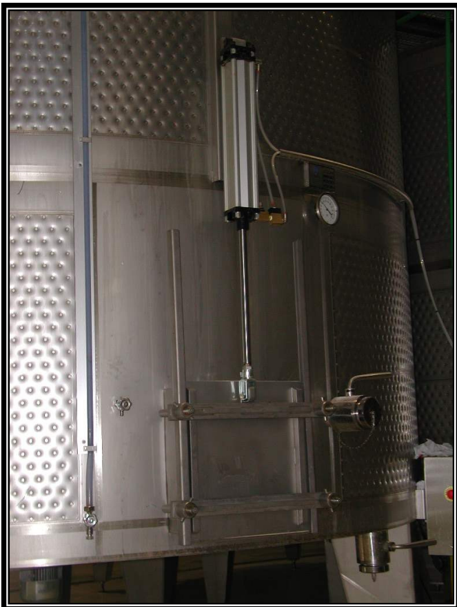
• DETALLE DE LA PUERTA NEUMATICA